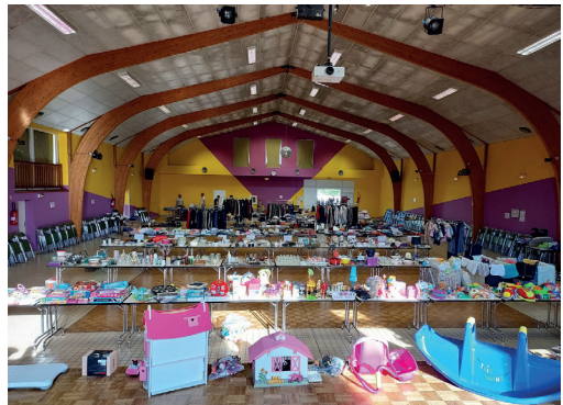
Salle des fêtes, rue de la Vieille Grolière Soubise

Dimanche 19 novembre : Prenez ! 10h-17h : prenez gratuitement les articles qui vous intéressent.