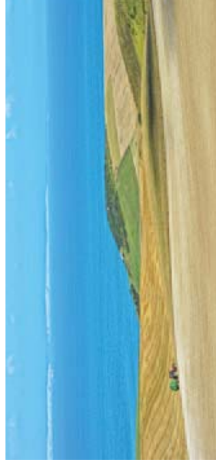
Les Deux Caps Blanc-Nez, Gris-Nez

Au regard de la protection, les membres du Réseau sont très fortement attachés à une approche globale de la protection de ces paysages, intégrant aussi bien la biodiversité, le patrimoine historique et culturel que les pratiques sociales et économiques qui façonnent le Grand Site de France.