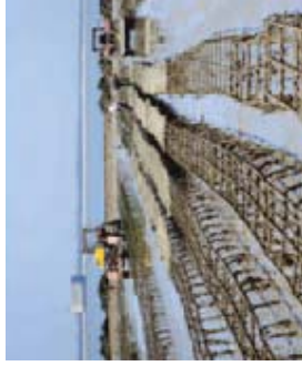
Estuaire de la Charente - Arsenal de Rochefort

Un Grand Site de France est un levier de développement local durable . Il engage le territoire vers l'avenir. La conduite du projet mobilise les partenaires dans une gouvernance partagée reposant sur la concertation.