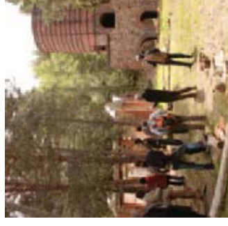
Massif du Canigó

Compte tenu de la spécificité des Grands Sites de France, la recherche permanente de l'équilibre entre protection et ouverture, entre fréquentation et préservation est une exigence. Ce qui conduit nécessairement à être capable de gérer la complexité et d'accepter et d'intégrer les paradoxes. Un Grand Site de France réclame avant tout une approche globale , permettant de faire la synthèse entre vision patrimoniale, économique et sociale (principes du développement durable).