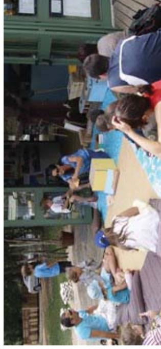
Atelier "Dans les coulisses d'un Grand Site" - Dune du Pilât

Les Grands Sites de France sont des lieux de vie, vivants et animés. Leurs gestionnaires sont très attachés à ce qu'ils soient des lieux d'accueil et de partage avec les visiteurs de l'esprit de ces lieux . Les valeurs à partager doivent être fortement exprimées par la volonté locale et elles doivent être proposées et accessibles à tous sans distinction de culture ou de moyens financiers.